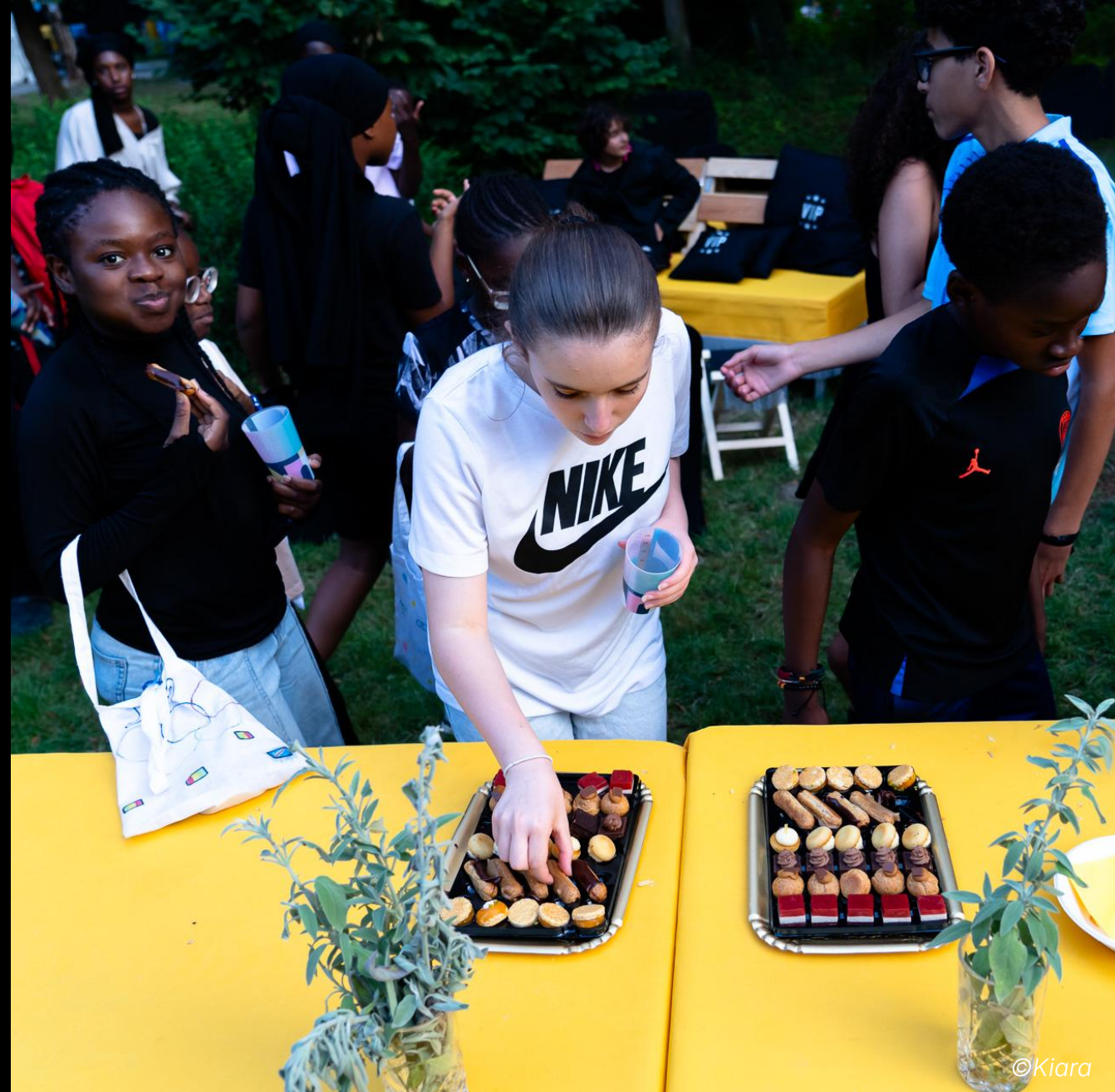
Goûter des pâtisseries, en préparer